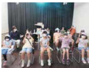
宇宙へしゃっぽーつ!