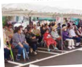
会場は来場者でいっぱい!