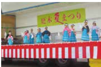
かわいい子供神楽