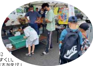
真剣に 金魚すくい。 「釣れたかな!？」